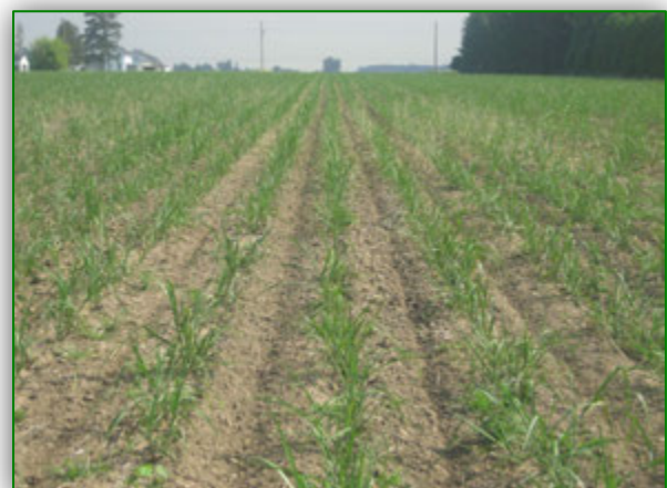
Plantaža Miscanthus x Giganteusa