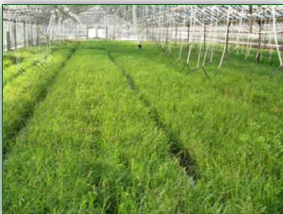
In-vitro potaknjenci dozorevajo v sadike

Spomladi se vitro potaknjenci preselijo iz laboratorija v rastlinjak in se posadijo v več-celične pladnje z zemljo in šoto, kjer se prilagajajo na zunanje pogoje rasti. Po nekaj tednih rasti (6-8) in razvoja v rastlinjaku, se lahko rastline neposredno presadijo na izbrano zemljišče oz. plantažo.