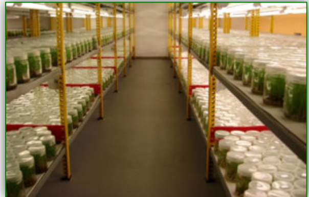
Rast in-vitro potaknjencev v nadzorovanih pogojih

Vse faze in-vitro razmnoževanja se vršijo v sterilnih laboratorijskih pogojih, pod strogo nadzorovanimi temperaturami, na posebnih medijih, ki vsebujejo optimalne sestavine za rast in ukoreninjanje rastlin.