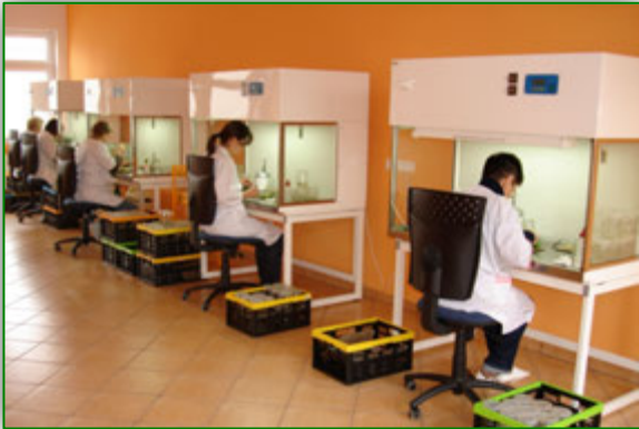
Laboratorij za pridelavo in-vitro potaknjencev

VitroGen Spółka z o.o. (Poljska) je naš partner in dobavitelj najbolj kakovostnih in-vitro potaknjencev in ex-vitro sadik sorte Miscanthus x Giganteus . Podjetje ima izjemno zbirko visoko donosnih genotipov (klonov), ki izhajajo tako iz Evrope kot in ZDA. VitroGen je specializirano podjetje, ki se ukvarja z razmnoževanjem izbranih genotipov v lastnih laboratorijih. Uporabljajo napredno tehnologijo in-vitro kultur.